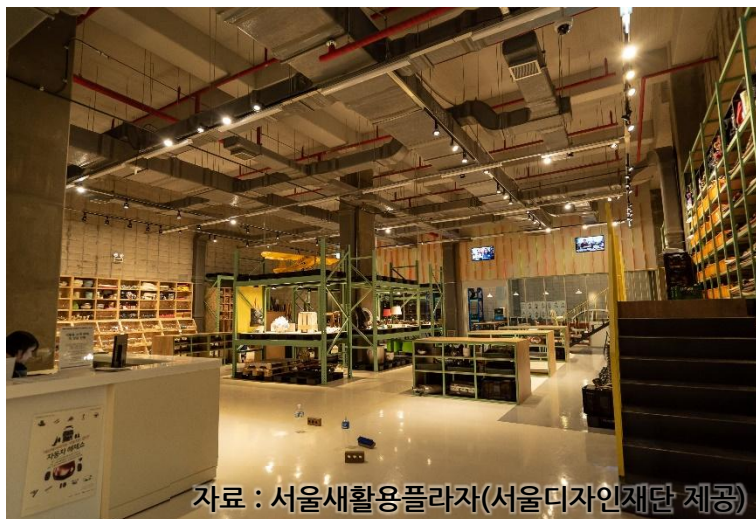
자료 : 서울새활용플라자(서울디자인재단 제공)