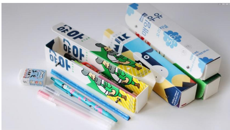
|| 밀키프로젝트의 밀키바통